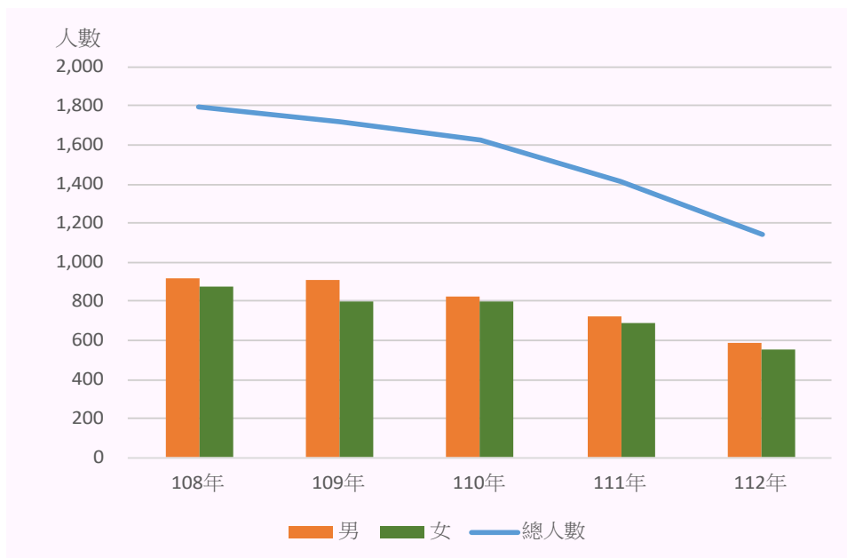
圖一 本區近 5 年粗結婚率及粗離婚率